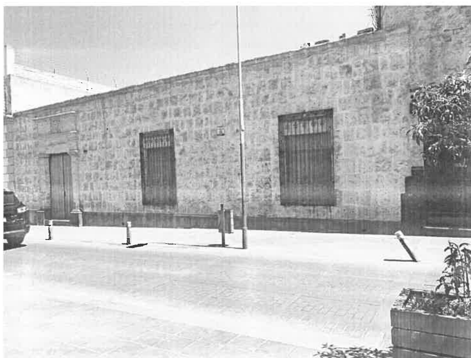
CALLE SUCRE N° 209, DONDE VIVIÓ EL CORONEL FRANCISCO BOLOGNESI.