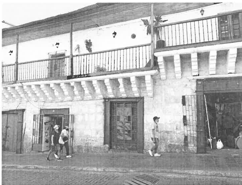
CASONA UBICADA EN LA ESQUINA DE LA CALLE CRUZ VERDE N° 119 – 119B CON EL PUENTE BOLOGNESI, DONDE VIVIÓ EL CORONEL FRANCISCO BOLOGNESI.