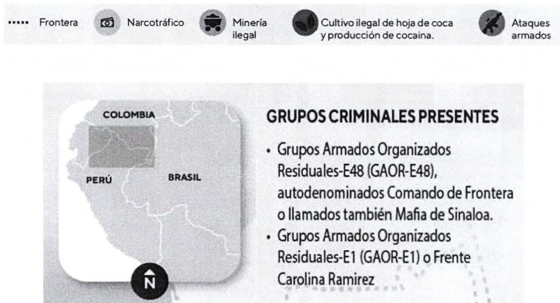
Gráfico 1: Actividades ilegales y grupos criminales presentes 5

En ese contexto, que se plantea la presente iniciativa legislativa, para fortalecer el rol del Estado en relación con la problemática existente en la región fronteriza entre Colombia y Perú, contribuyendo a la seguridad y el desarrollo del Estado peruano.