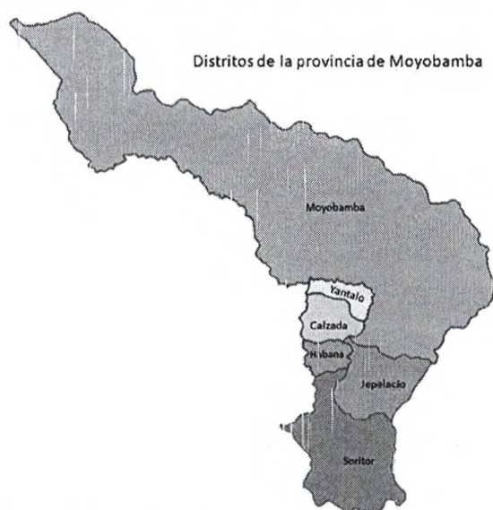
Gráfico 2: Mapa de la provincia de Moyobamba

Moyobamba se destaca por su posición estratégica como un nexo entre las regiones amazónicas y andinas del Perú, lo que le confiere un papel crucial en los esfuerzos nacionales por conservar la biodiversidad y promover un desarrollo sostenible. El potencial de la provincia para el desarrollo de tecnologías agrícolas sostenibles, turismo ecológico y educación ambiental es significativo y representa una oportunidad única para proyectos de desarrollo regional que integren conservación ambiental con crecimiento económico.