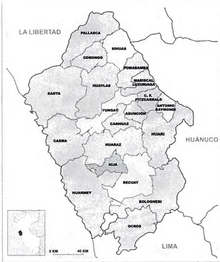
Imagen 01: Mapa político del departamento de Ancash