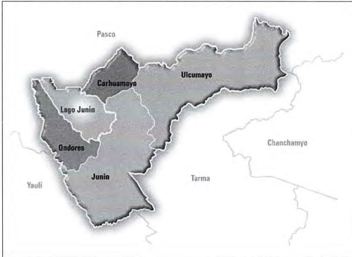
Figura 1. Mapa de la provincia de Junín, en el departamento de Junín.

en el caso de los jóvenes genera la probabilidad de certificar a los estudiantes que cursen los últimos años de educación secundaria que ya hayan estado desarrollando alguna competencia en campo.