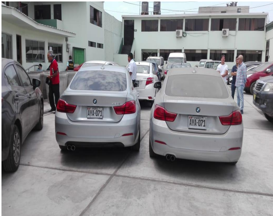
Recuperación de vehículo robado bajo la modalidad de “clonación” (uno con placa original AYA-071 y el otro con placa AYA-071 pero duplicada D1).

Los vehículos con placas clonadas son también utilizados por la delincuencia para robos secuestros y otros delitos, pues al encontrarse la placa que exhiben, libre de órdenes de captura, podrán circular libremente por el país. Incluso son sacados por las fronteras fuera del país, con esta modalidad, sin necesidad de cambio de números de chasis y motor, solo exhibiendo una placa de vehículo similar, sin orden de captura.