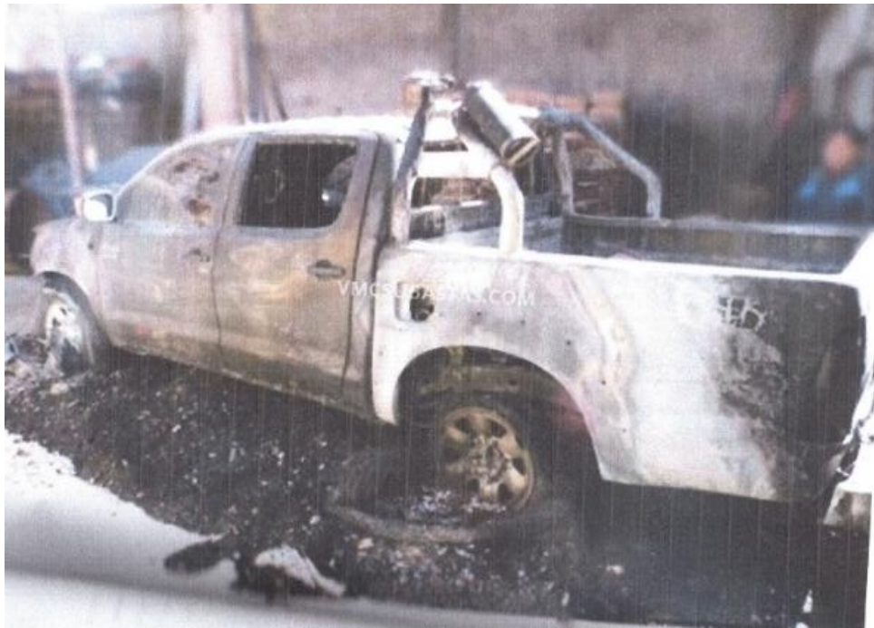
Imagen del vehículo siniestrado (incendiado) de placas ADM-858.

comprador resulta ser un agraviado de estafa, quien lógicamente recién critica al sistema de transferencias vehiculares de nuestro país.