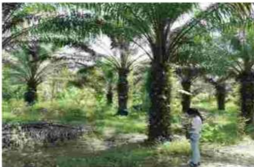
Figura 3. Cultivo de palma aceitera en el centro poblado Libertad.

Abarca unas 9 588,43 ha (2,03% del área). Este cultivo es promocionado por el Programa de Desarrollo Alternativo, con el apoyo de UNODC, DEVIDA y el Gobierno Local, que paulatinamente viene reemplazado al cultivo de hoja de coca con buenos resultados. Las plantaciones generalmente se instalan en terrenos con bosques secundarios (purmas), que anteriormente estuvieron con cultivos de coca. Los centros poblados con mayor abundancia de cultivos de palma son Paujil, Santa Trinidad de Mediación, Boqueron, Río Blanco, Micaela Bastidas, San Pedro Alto, Santa Anita Alta, San Pedro Alto, Pampa Yurac, Mariela, Miraflores y Bajo Shambillo.