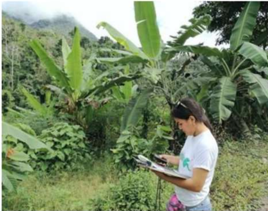
Figura 4. Cultivo de plátano ubicado en el centro poblado Centro Yurac.

“Decenio de la Igualdad de Oportunidades para mujeres y hombres” “Año de la recuperación y consolidación de la economía peruana”