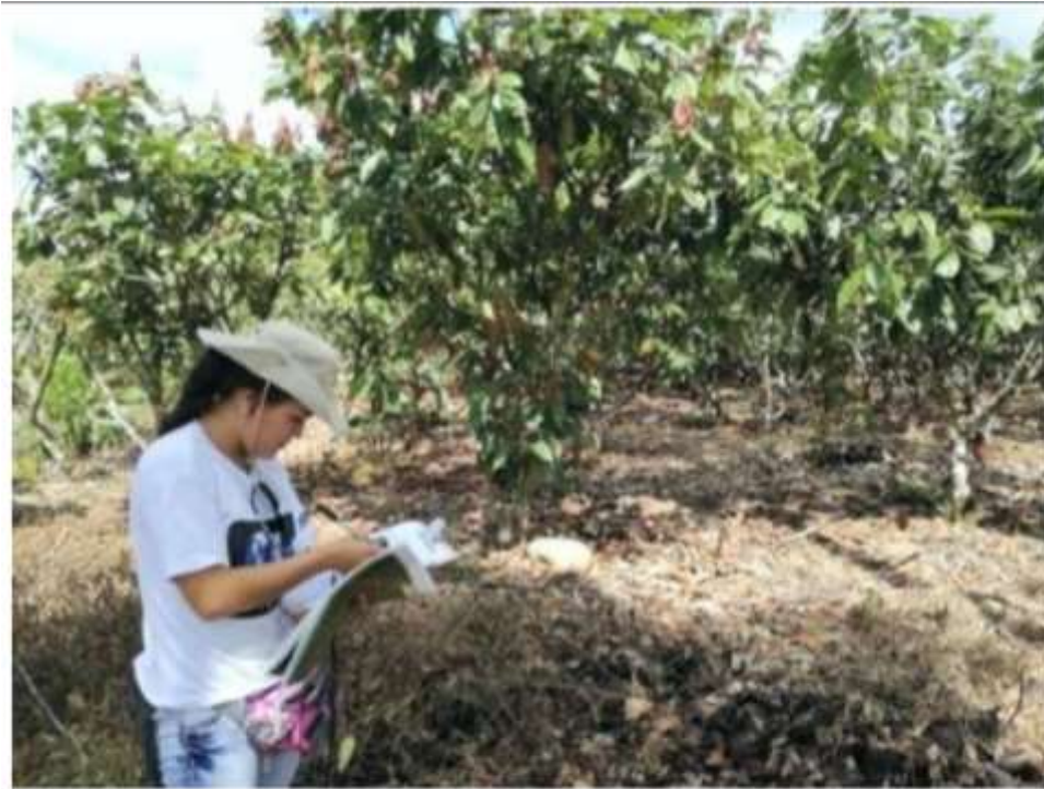
Figura 5. Cultivo de cacao ubicado en el centro poblado Libertad.