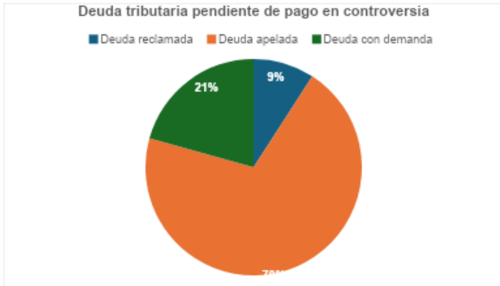
Gráfico N° 03