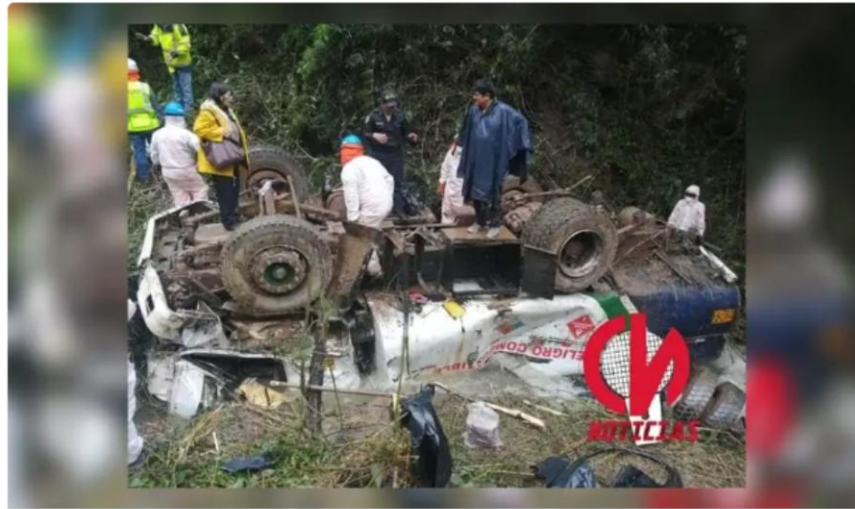
Camión cisterna que cayó al río sería proveedor de empresa que realiza obras en la carretera Huánuco-La Unión.