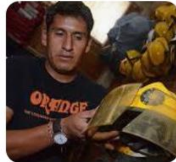
Bomberos sin equipo para las... Los Tiempos

Esta situación la podemos corroborar en el Informe de Auditoría N° 006-2023-2-3601-AC, AUDITORIA DE CUMPLIMIENTO-INTENDENCIA NACIONAL DE BOMBEROS DEL PERÚ o INBP, sobre “Gestión del Equipamiento de la Compañías de Bomberos de Lima Metropolitana”, períodos 1 de enero de 2021 a 31 de diciembre de 2022, del 27 de junio de 2023 2 .