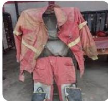
Equipos deteriorados y vehíc... Latina Noticias