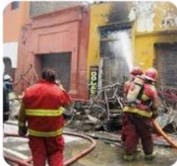
Arequipa: bomberos sin equi... RPP Noticias

https://diariocorreo.pe/edicion/ica/ica-bomberos-de-la-tinguina-sin-proteccion-ni-oxigeno-para-afrontar-emergencias-noticia/?fbclid=IwZXh0bgNhZW0CMTEAAR7IVAE4dqswqA79nOWCWuE2wjQ9TySQ2DYIWCNbwQD2EgOKDX9G-6L7y0Rrfg_aem_uo13jUaLARXaA2ucdLoOYQ&sfnsn=wa