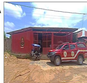
CIA Nauta N° 175

VALOR TOTAL DE LA EJECUCIÓN: S/ 1,478,650,000.00