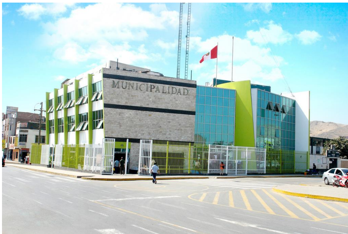
Imagen referencial del futuro palacio municipal del distrito de San Sebastián de Sacraca

necesidad de consolidar un Estado más cercano a la ciudadanía mediante la creación de nuevas unidades político-administrativas que garanticen una gestión pública eficiente, participativa y transparente, en concordancia con los objetivos legislativos de promover el desarrollo equitativo de las regiones y optimizar la prestación de servicios básicos en beneficio de la población rural del futuro distrito de San Sebastián de Sacraca, provincia de Paucar del Sara Sara, departamento de Ayacucho.