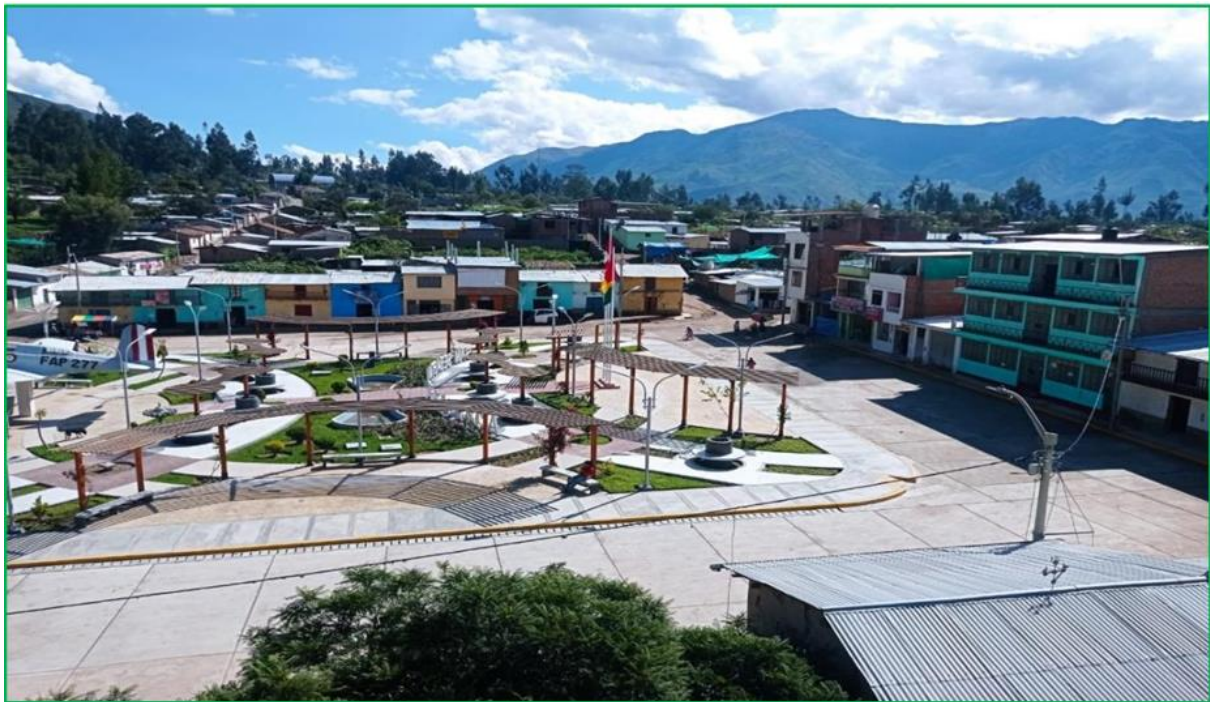
Imagen N° 03: fotografía de la vista panorámica del futuro distrito de San Sebastián de Sacraça.