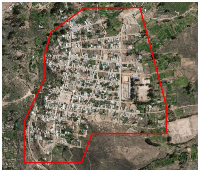
Imagen N° 01: toma satelital de ubicación del futuro distrito de San Sebastián de Sacraca. 1