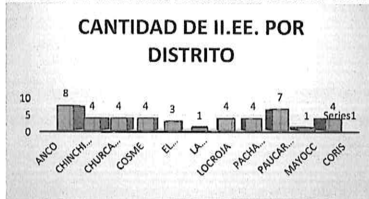
Gráfico N° 2: Instituciones Educativas de educación Secundaria por Distrito.

Adicionalmente a la información cuantitativa de las Instituciones Educativas de educación Secundaria por Distrito.