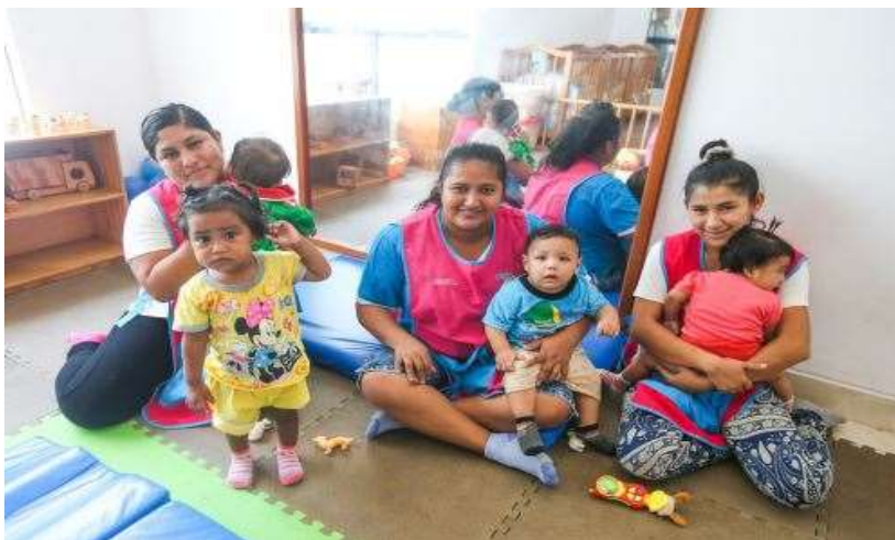
Panel fotográfico 1 – (Fuente Cunamas)

Sin embargo, los registros administrativos evidencian una elevada tasa de deserción de madres cuidadoras en el SCD. Al cierre de diciembre de 2014, la deserción alcanzó el 38,5 % en 2012 y el 30,9 % en 2013 a nivel nacional. Esta situación afecta negativamente la continuidad y la calidad del servicio, además de implicar una pérdida significativa de los recursos económicos invertidos por el PNCM en la capacitación y fortalecimiento de las capacidades de las madres cuidadoras (BID, 2014), principalmente analizar las causas que explican la deserción de las madres cuidadoras, poniendo especial énfasis en la relación existente entre el gasto de colaboración y la decisión de abandono del servicio. Asimismo, se busca estimar los costos financieros asociados a dicha deserción y evaluar su impacto en la calidad de la prestación del Servicio de Cuidado Diurno, en ese sentido es fortalecer la calidad del servicio y asegurar el cumplimiento de los lineamientos, estándares de calidad y objetivos estratégicos del Programa Nacional Cuna Más, contribuyendo así a una política pública más eficiente y equitativa en favor de la primera infancia bajo el cuidado de madres colaboradoras.