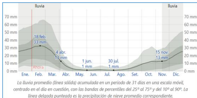
Gráfico 2: promedio mensual de lluvias de en el distrito de El Tambo-provincia de Huancayo