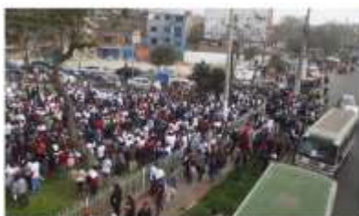
Los vecinos de San Juan de Lenguaño quieren que busquen defender los límites de su distrito. (Foto: @S3M Noticias).