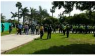
Personal de Magdalena y San Isidro protagonizaron batalla campal en el parque La Pera del Áncash.