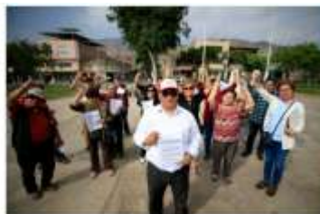
Los residentes de la urbanización Mesa Redonda demandan que estén siendo prestados por la Municipalidad de Independencia para pagar tributos en dicho distrito. Muchos de ellos han realizado solicitudes de embargo de sus propiedades. Sin embargo, los vecinos afirman que ellos tributan en San Martín de Porres.