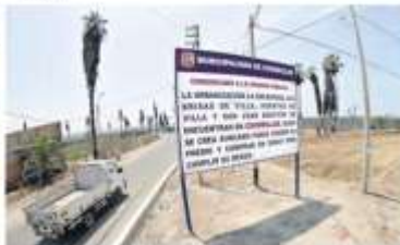
Esto es el panel que la Municipalidad de Chorrillos colocó en La Encantada.