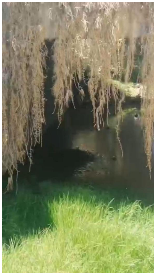
HUALALACHI - Av. HUALALACHI Sector RICARDO PALMA LUGAR DENOMINADO SOCCOS HUAICCO