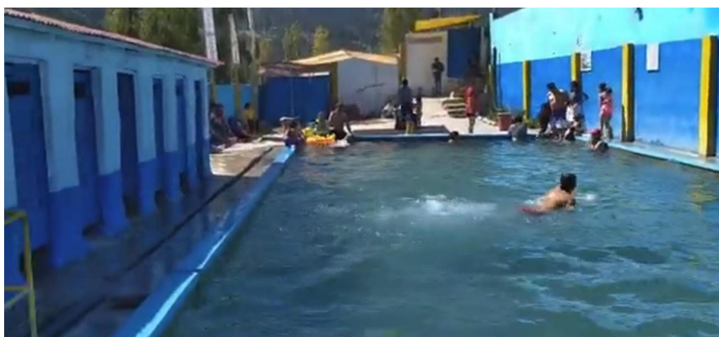
HUALALACHI - Av. HUALALACHI. LUGAR DENOMINADO BAÑOS PATA