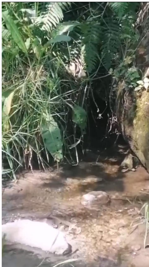
HUALALACHI - Sector CCAYHUAPATA LUGAR DENOMINADO HUITON HUAYCCO