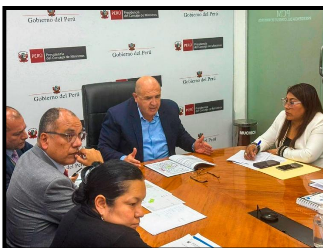
Reunión con la PCM para abordar la problemática limítrofe.