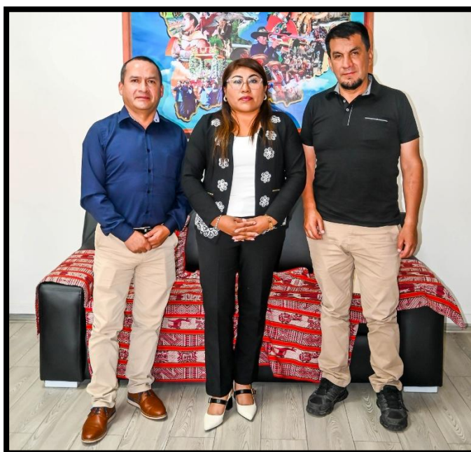
Reunión con alcalde provincial de Aymaraes para abordar la problemática limítrofe.

Ministerial N° 314-2025-PCM de fecha 10 de noviembre de 2025, donde se aprueba el área de consulta popular propuesta por la Secretaría de Demarcación y Organización Territorial. De acuerdo a la información del Instituto Nacional de Estadística e Informática - INEI, Los centros poblados se ubican en el distrito de Cotaruse de la provincia de Aymaraes del departamento de Apurímac. Por ello, solicitaron que se respete el Acta de Acuerdo de Límites suscrito entre los Gobernados regionales de los GORE de Apurímac y Ayacucho, y la Secretaría de Demarcación y Organización Territorial - SDOT el 23 de mayo de 2014.