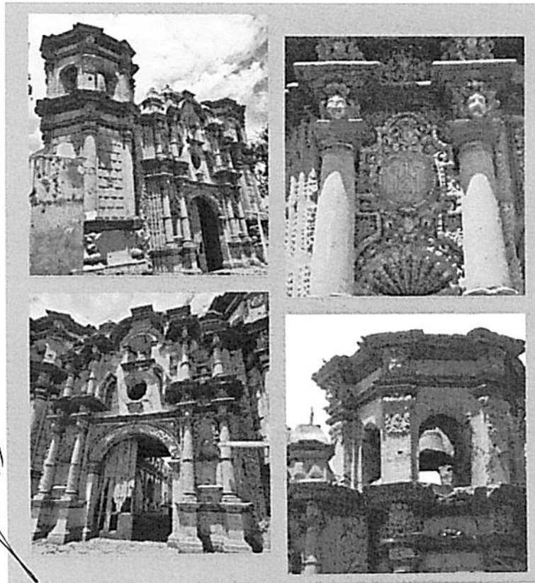
Fotos: Fachada de la Iglesia San Javier ubicada en el Distrito de Changuillo, Provincia de Nasca – Región Ica.

https://www.facebook.com/61554021114192/posts/arquitectura-iglesia-de-san-francisco-xavierde-la-antigua-hacienda-jesuita-chang/122233148978134037/