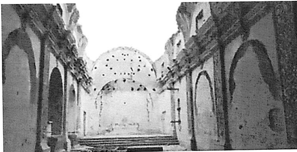
FOTO: Interior de la Iglesia San Javier ubicada en el Distrito de Changuillo, Provincia de Nasca – Región Ica.

https://www.facebook.com/61554021114192/posts/arquitectura-iglesia-de-san-francisco-xavierde-la-antigua-hacienda-jesuita-chang/122233148978134037/