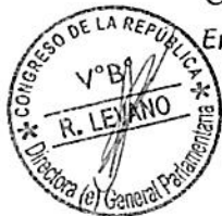
FERNANDO MIGUEL ROSPIGLIOSI CAPURRO Presidente encargado del Congreso de la República

En Lima, a los nueve días del mes de junio de dos mil veintiséis.