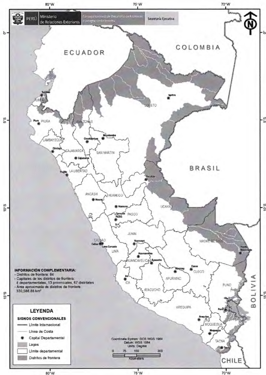
Mapa 2: Franja de Frontera conformada por 84 distritos adyacentes al perímetro fronterizo

“Decenio de la Igualdad de Oportunidades para mujeres y hombres” " Año del Fortalecimiento de la Soberanía Nacional”