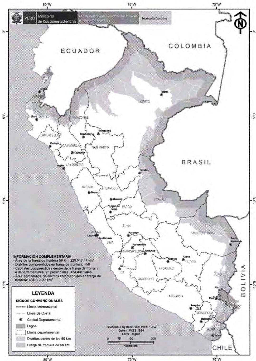
Mapa 1: Franja de Frontera de 50 km y distritos comprendidos en dicho espacio

“Decenio de la Igualdad de Oportunidades para mujeres y hombres” " Año del Fortalecimiento de la Soberanía Nacional”