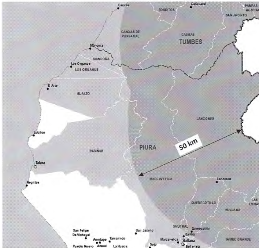
Imagen 1: Ejemplo de distritos comprendidos parcialmente dentro de la Franja de Frontera de 50 km desde la línea de frontera