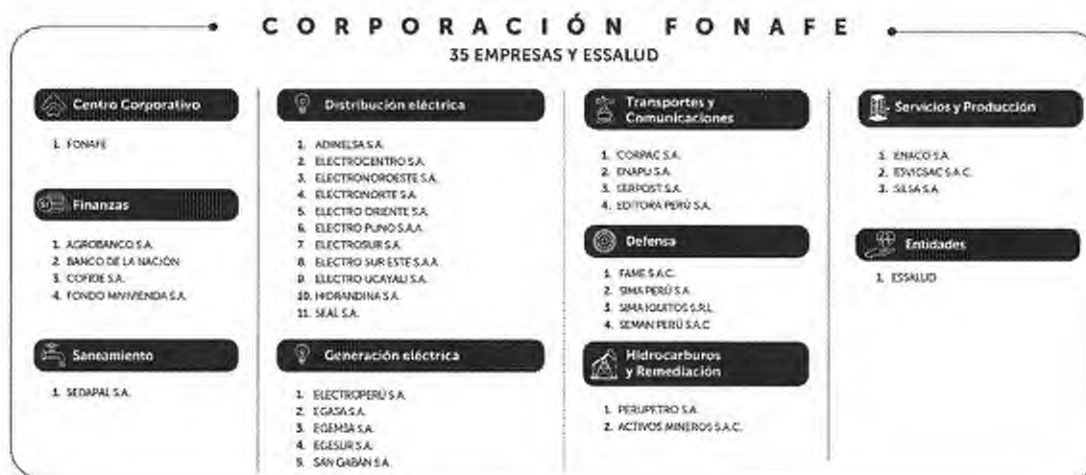
CUADRO N.º 2: Plan Estratégico Cooperativo FONAFE